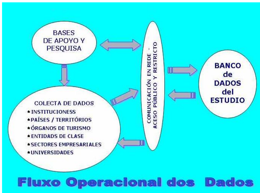
Figura 3: Flujo Operacional dos Datos